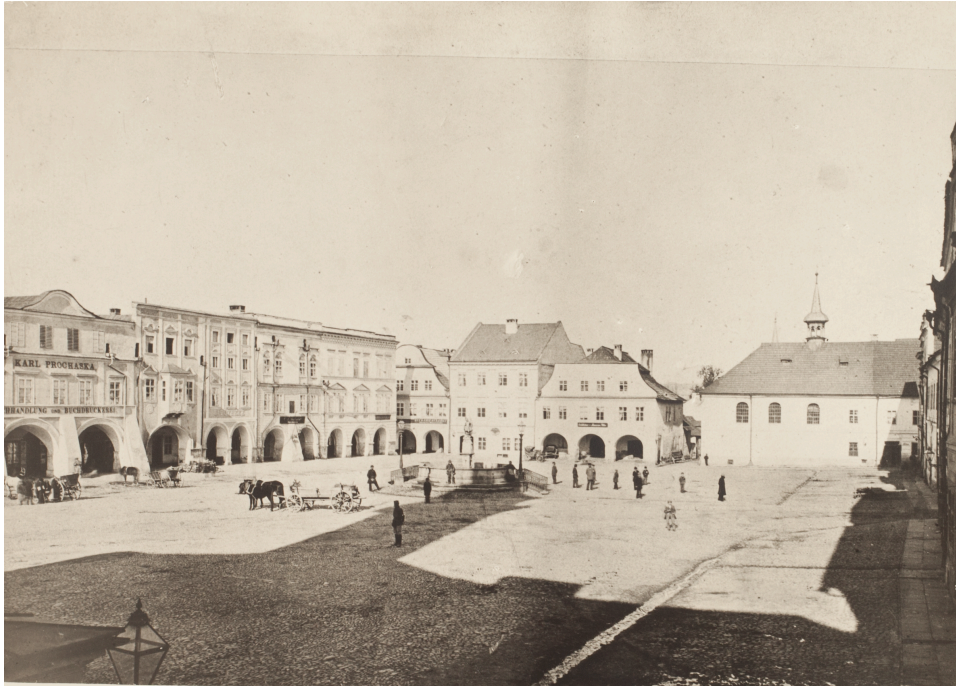
Ryc.8 Studnia i Fontanna św. Floriana