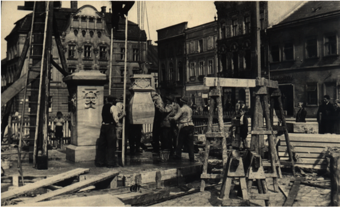
Ryc.12 Remont fontanny św. Floriana, rok 1942