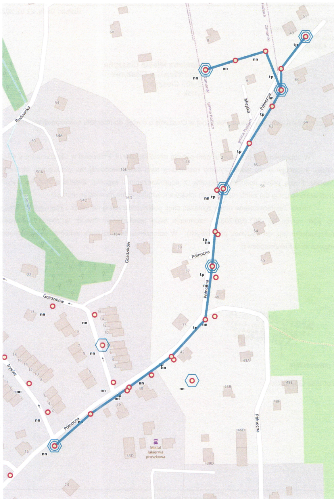
Schemat sieci światłowodowej odcinka ulicy Północnej w Cieszynie (od ul. Irysów do końca)