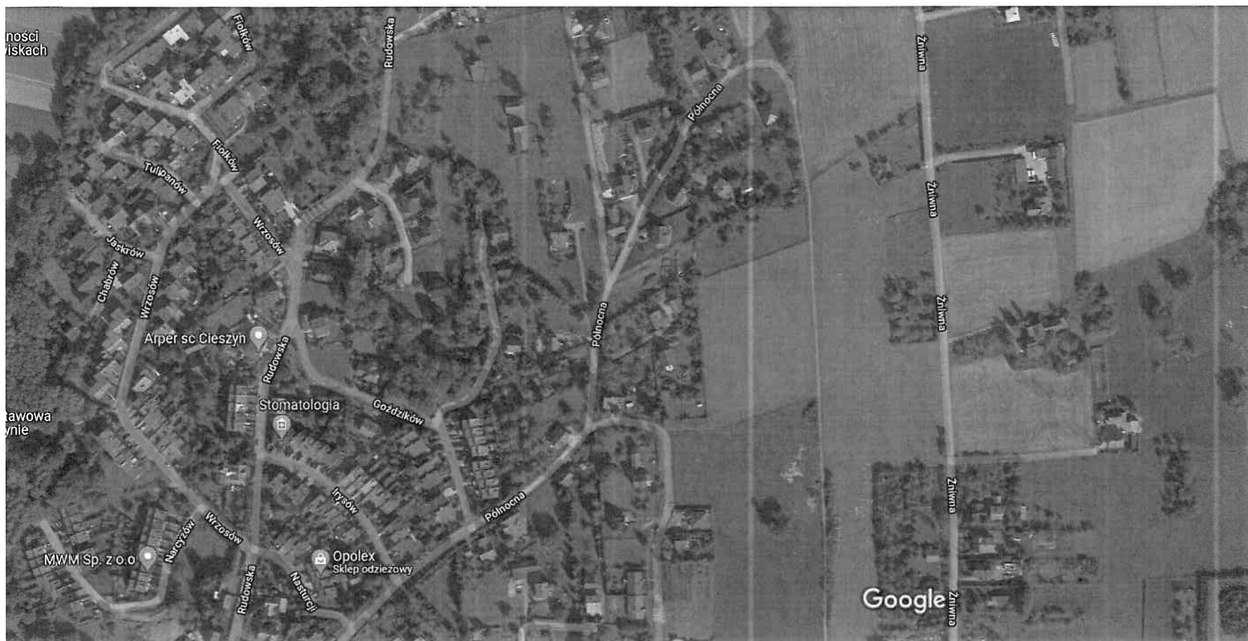
50 m

cieszyn ul. północna 33 Północna 33, 43-400 Cieszyn