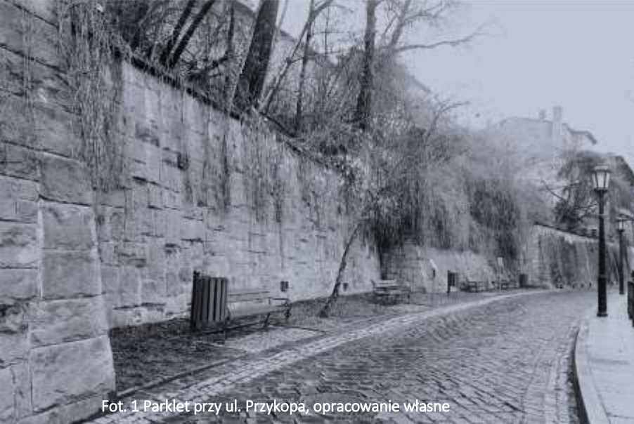
Fot. 1 Parklet przy ul. Przykopa, opracowanie własne