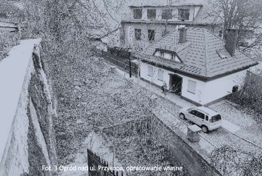
Fot. 3 Ogród nad ul. Przykopa, opracowanie własne