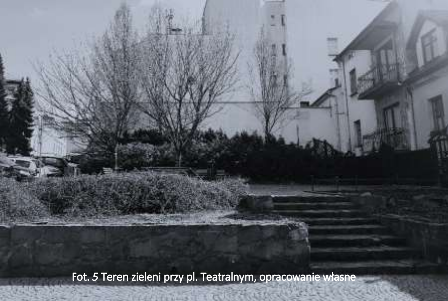
Fot. 5 Teren zieleni przy pl. Teatralnym, opracowanie własne