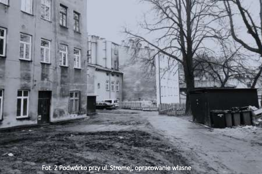
Fot. 2 Podwórkę przy ul. Stromej, opracowanie własne