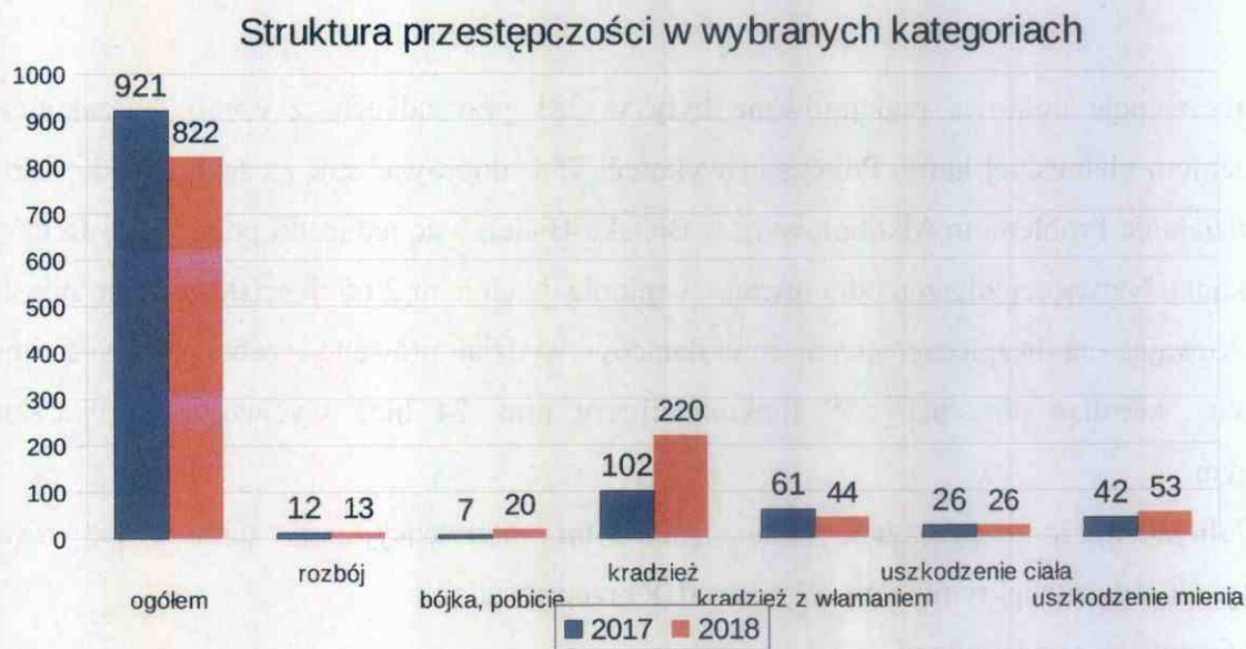
Wykres nr 1

Analiza stanu bezpieczeństwa i porządku publicznego wskazuje, że miasto jest bezpieczne. Liczba przestępstw odnotowanych w mieście w roku 2018 stanowi zaledwie 0,7 procenta (spadek o 0,1%) wszystkich przestępstw w województwie śląskim, których było 115 333 i 29 procent wszystkich zdarzeń w powiecie (wzrost o 5 %).