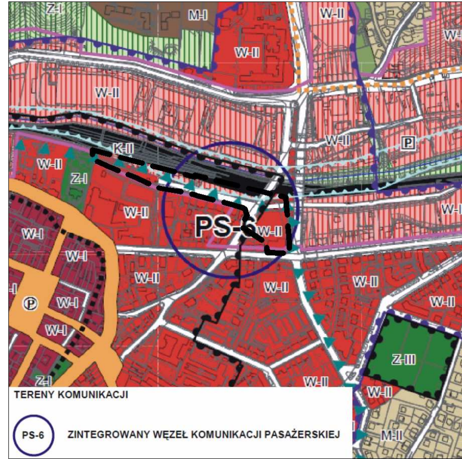
STUDIUM UWARUNKOWAŃ I KIERUNKÓW ZAGOSPODAROWANIA PRZESTRZENNEGO MIASTA CIESZYNA FRAGMENT RYSUNKU: "KIERUNKI ROZWOJU STRUKTURY PRZESTRZENNEJ" w skali 1 : 10 000