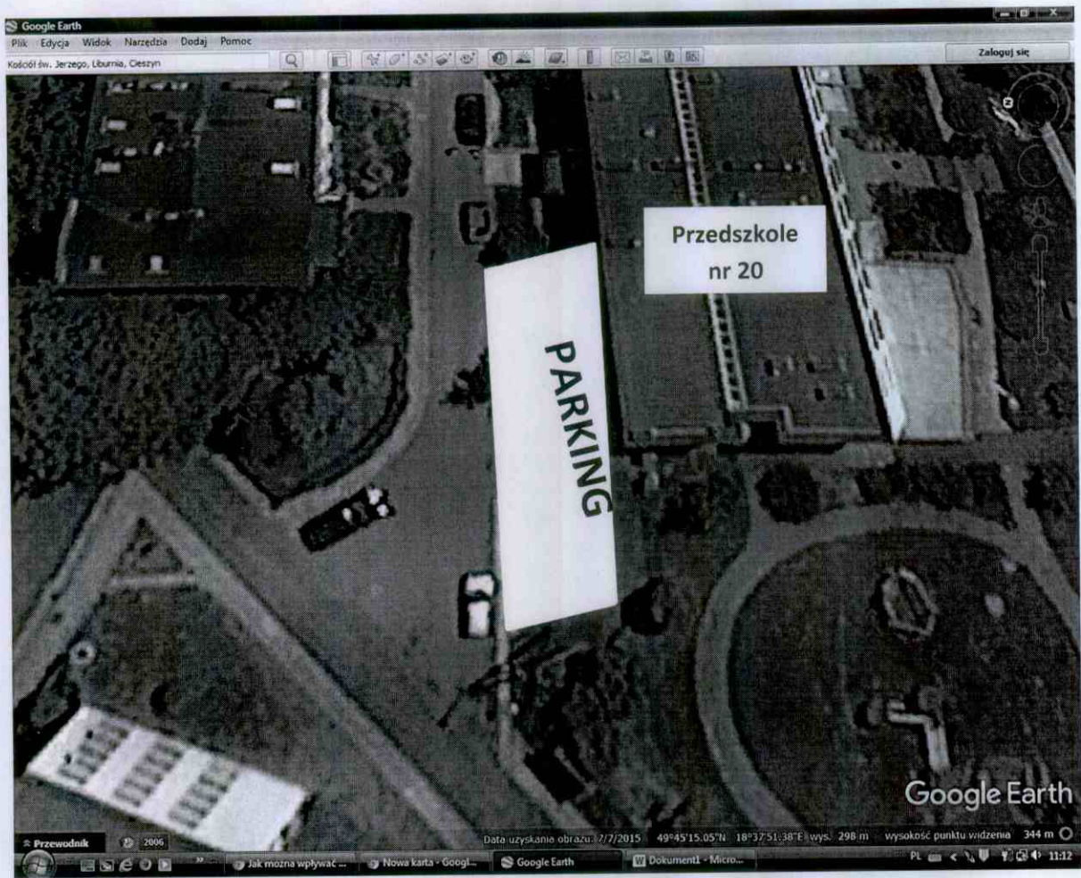
Fot. 2 Planowane miejsce parkingu przed przedszkolem nr 20 widok z góry.