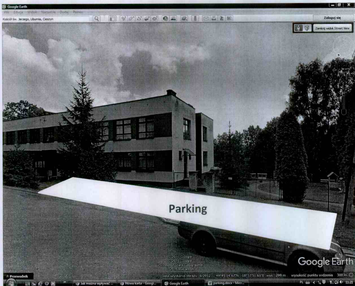
Fot. 2 Planowane miejsce parkingu przed przedszkolem nr 20