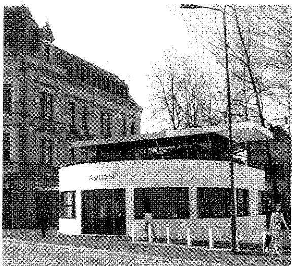
Kawiarnia Avion- Koncepcja

Według wstępnych wyliczeń kosztów eksploatacji oraz zarządzania obiektem, działalność w nim prowadzona nie powinna spowodować konieczności zwiększenia dotacji dla Zamku.