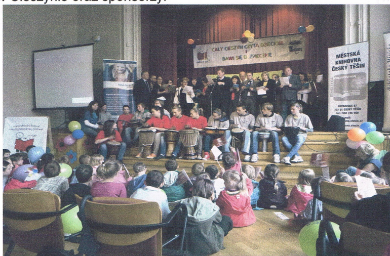
Ze względu na niesprzyjającą pogodę część artystyczna odbyła się w Domu Narodowym

„Cały Cieszyn czyta dzieciom i bawi się bezpiecznie” – impreza zorganizowana 1 czerwca z okazji Dnia Dziecka w Domu Narodowym oraz na Rynku, adresowana do uczniów szkół podstawowych i przedszkolaków. Głównym celem imprezy było propagowanie wśród uczniów szkół podstawowych i przedszkolaków czytania książek oraz bezpiecznych zachowań i przyjaznego wizerunku służb porządkowych funkcjonujących na terenie Cieszyna (Policja, Straż Miejska, Straż Pożarna, Straż Graniczna). Cel był realizowany poprzez uczestnictwo w głośnym czytaniu, występach artystycznych i konkursach oraz poznanie z bliska sprzętu wykorzystywanego przez wspomniane służby. Zwycięzca konkursu wiedzy o bezpieczeństwie, przeprowadzonym częściowo na Hali Widowiskowo-Sportowej im. Cieszyńskich Olimpijczyków podczas imprezy „Jedź z głową”, wygrał rower górski. Na scenie dzieci miały możliwość obejrzenia występu zespołów wokalnych. Uczestnicy zabaw i konkursów otrzymywali okolicznościowe koszulki, długopisy oraz napoje, ciasta i lody, sponsorowane przez restauratorów działających wokół Rynku. Oprócz Straży Miejskiej współorganizatorami imprezy były: Biblioteka Miejska, Cieszyński Ośrodek Kultury „Dom Narodowy”, KPP Cieszyn, KP Państwowej Straży Pożarnej w Cieszynie, Zespół Obsługi Jednostek Oświatowych, Placówka Straży Granicznej w Cieszynie oraz sponsorzy.