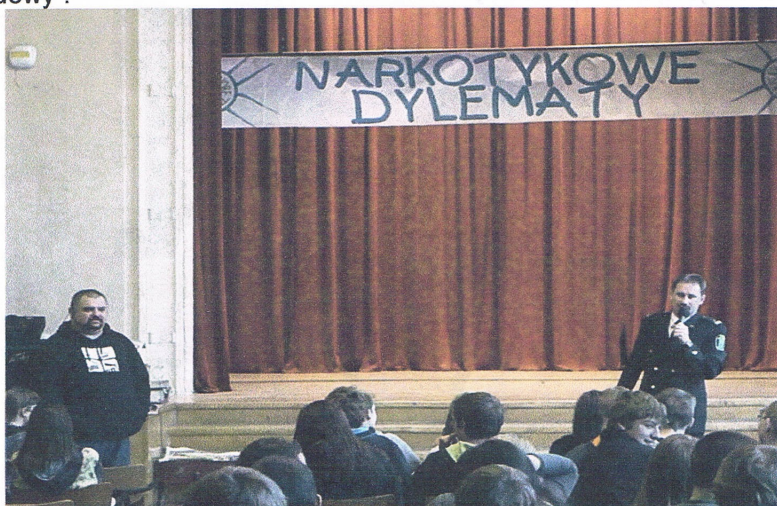
Spotkanie gimnazjalistów w Domu Narodowym z instruktorem terapii uzależnień

„Narkotykowe Dylematy” – akcja przeprowadzona w Domu Narodowym w dniach 7 i 9 listopada adresowana do młodzieży gimnazjalnej, celem której było pokazanie skutków zażywania narkotyków. Pierwszego dnia odbyły się warsztaty dla klas pierwszych prowadzone przez instruktora terapii uzależnień ze Stowarzyszenia „Arka Noego” z Ostrowa Wielkopolskiego (3 grupy - ok. 400 uczestników). Natomiast w drugim dniu gimnazjaliści klas drugich uczestniczyli w spektaklu teatralnym „Wspomnienia Narkomanki” przygotowanym przez Agencję Artystyczną Joanna z Kielc (3 spektakle – ok 360 uczestników). Realizatorami była Straż Miejska oraz Cieszyński Ośrodek Kultury „Dom Narodowy”.