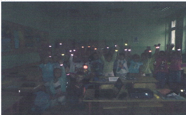
Dzieci sprawdzają efekt noszenia elementów odblaskowych

„Bezpieczna droga do szkoły z odblaskami” – akcja zrealizowana w ramach podprogramu „Bezpieczna Szkoła”, polegająca na przeprowadzaniu spotkań uczniów klas pierwszych szkół podstawowych z policjantami lub strażnikami miejskimi, podczas których dzieci zapoznawane były z zasadami poruszania się po drogach oraz otrzymywały opaski odblaskowe. W dniach od 17 do 25 września strażnicy miejscy przeprowadzili zajęcia z uczniami wszystkich klas pierwszych Szkół Podstawowych. Oprócz spotkań w trakcie roku szkolnego strażnicy codziennie zabezpieczali przejścia dla pieszych, położone w pobliżu szkół: SP – 1, SP – 2, SP – 3, SP – 4, SP – 6, oraz okazjonalnie przy SP – 7 i Szkole Alternatywnej, w celu zapewnienia dzieciom bezpiecznego dojścia do szkół. Na potrzeby akcji zakupione zostały elementy odblaskowe, które były i będą wręczane podczas spotkań z dziećmi.