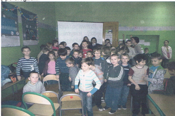
Spotkanie z uczestnikami półkolonii w SP-4

„Cały Cieszyn czyta dzieciom i bawi się bezpiecznie” – impreza zorganizowana 1 czerwca z okazji Dnia Dziecka w Domu Narodowym oraz na Rynku, adresowana do uczniów szkół podstawowych i przedszkolaków. Głównym celem imprezy było propagowanie wśród uczniów szkół podstawowych i przedszkolaków czytania książek oraz bezpiecznych zachowań i przyjaznego wizerunku służb porządkowych funkcjonujących na terenie Cieszyna (Policja, Straż Miejska, Straż Pożarna, Straż Graniczna). Cel był realizowany poprzez uczestnictwo w głośnym czytaniu, występach artystycznych i konkursach oraz poznanie z bliska sprzętu wykorzystywanego przez wspomniane służby. Zwycięzca konkursu wiedzy o bezpieczeństwie, przeprowadzonym częściowo na Hali Widowiskowo-Sportowej im. Cieszyńskich Olimpijczyków podczas imprezy „Jedź z głową”, wygrał rower górski. Na scenie dzieci miały możliwość obejrzenia występu zespołów wokalnych. Uczestnicy zabaw i konkursów otrzymywali okolicznościowe koszulki, długopisy oraz napoje, ciasta i lody, sponsorowane przez restauratorów działających wokół Rynku. Oprócz Straży Miejskiej współorganizatorami imprezy były: Biblioteka Miejska, Cieszyński Ośrodek Kultury „Dom Narodowy”, KPP Cieszyn, KP Państwowej Straży Pożarnej w Cieszynie, Zespół Obsługi Jednostek Oświatowych, Placówka Straży Granicznej w Cieszynie oraz sponsorzy.