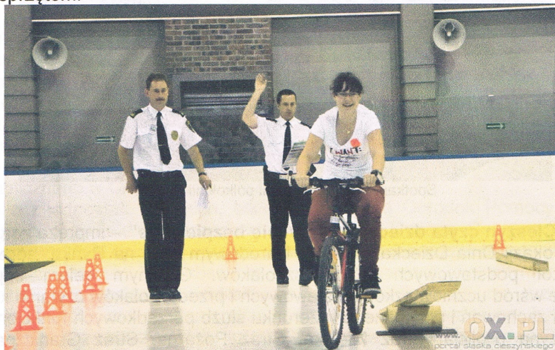
Rowerowy tor przeszkód podczas imprezy „Jedź z głową” zorganizowanej przez MOSiR

„Jedź z głową” – impreza zorganizowana przez MOSiR 1 czerwca z okazji Dnia Dziecka w Hali Widowiskowo-Sportowej im. Cieszyńskich Olimpijczyków, adresowana do gimnazjalistów oraz uczniów klas piątych i szóstych szkół podstawowych. Głównym celem imprezy było propagowanie zasad bezpiecznego poruszania się na rowerze oraz przypomnienie podstawowych przepisów Prawa o ruchu drogowym. Uczestnicy oprócz udziału w rozmaitych konkursach, między innymi w rowerowym torze przeszkód prowadzonym wspólnie przez strażnika miejskiego i policjanta „drogówki”, mogli wysłuchać rad doświadczonych kolarzy oraz zapoznać się najnowszymi modelami rowerów i osprzętem.