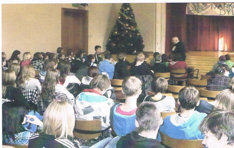
Spotkanie gimnazjalistów w Domu Narodowym z instruktorem terapii uzależnień

“Narkotykowe Dylematy” – impreza zrealizowana w ramach stałego podprogramu o tej samej nazwie, adresowanego głównie do młodzieży gimnazjalnej i szkół średnich. Celem podprogramu jest ograniczenie zjawiska narkomanii i składa się z dwóch elementów. W ramach pierwszego policjanci z KPP przeprowadzają szkolenia dla nauczycieli, spotkania z młodzieżą oraz prelekcje dla rodziców. Drugi element to impreza podsumowująca, na którą składały się cztery spotkania warsztatowe w Domu Narodowym z instruktorem terapii uzależnień ze Stowarzyszenia „Arka Noego” z Ostrowa Wielkopolskiego, w których uczestniczyła młodzież ze wszystkich klas pierwszych cieszyńskich gimnazjów (ok. 600 uczestników). Podczas warsztatów (29.11 i 05.12) uczestnikom rozdawano specjalnie opracowane przez strażników i policjantów ulotki „Poznaj prawdę o narkotykach”. Głównymi realizatorami była Straż Miejska, Cieszyński Ośrodek Kultury „Dom Narodowy” oraz KPP Cieszyn.