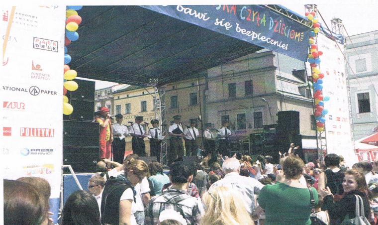
Służby mundurowe czytają bajki podczas imprezy

zabaw i konkursów otrzymywali okolicznościowe koszulki, balony, długopisy oraz napoje, ciasta i lody, sponsorowane przez restauratorów działających wokół Rynku. Oprócz Straży Miejskiej współorganizatorami imprezy byli: Biblioteka Miejska, Cieszyński Ośrodek Kultury „Dom Narodowy”, KPP Cieszyn, KP Państwowej Straży Pożarnej w Cieszynie, Wydział Oświaty Urzędu Miejskiego, Placówka Straży Granicznej w Cieszynie, Hufiec Ziemi Cieszyńskiej oraz sponsorzy.