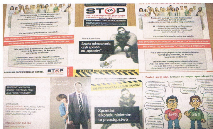
materiały przekazywane przez strażników miejskich sprzedającym alkohol i papierosy

Istotnym elementem akcji było szkolenie dla sprzedawców prowadzących sprzedaż alkoholu i papierosów, zorganizowane w dniu 01.12.2011r w siedzibie MOPS.