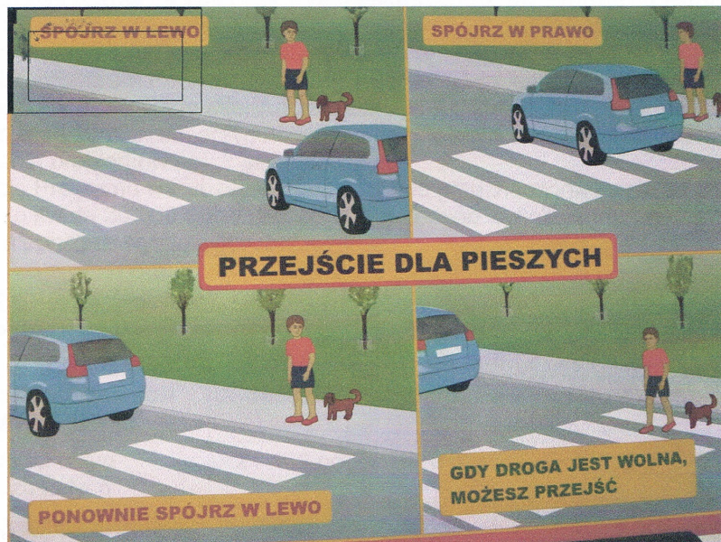
Jedna z zakupionych plansz poglądowych

sytuacjach oraz materiały edukacyjne dotyczące profilaktyki uzależnień i zagrożeń w cyberprzestrzeni, które będą wykorzystane podczas spotkań z dziećmi, młodzieżą i rodzicami.