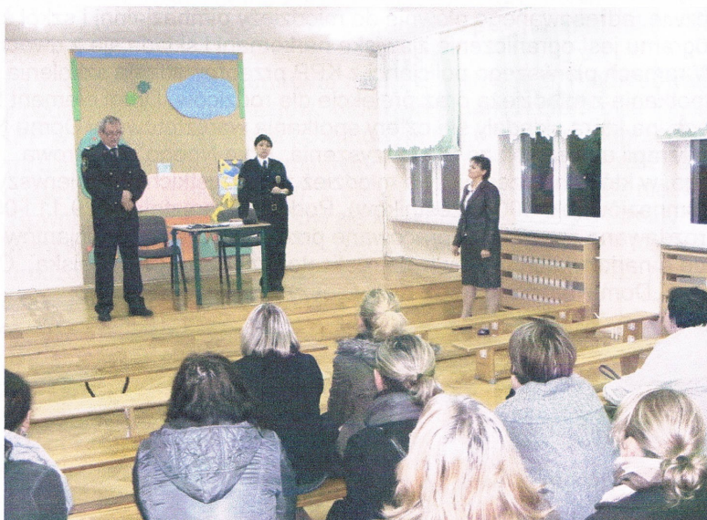
Spotkanie z rodzicami uczniów klas VI SP2

Ponadto codziennie w trakcie roku szkolnego strażnicy miejscy patrolowali rejony wokół gimnazjów i szkół średnich (w godzinach dużych przerw) pod kątem zachowania młodzieży i eliminacji osób niepożądaných.