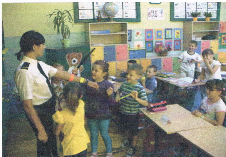
Strażnik miejski na zajęciach z dziećmi klas I

Y Alternatywnej, w celu zapewnienie a dzieciom bezpiecznego dojścia do szkół.