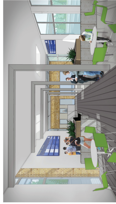
WIZUALIZACJA | WIDOK DWORCA KOLEJOWEGO - HOL Z POCZEKALNIĄ I KAWIARNIĄ