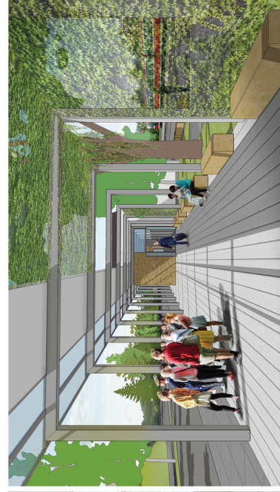
WIZUALIZACJA | WIDOK ZADASZONEGO POŁĄCZENIA DWORCA KOLEJOWEGO I AUTOBUSOWEGO