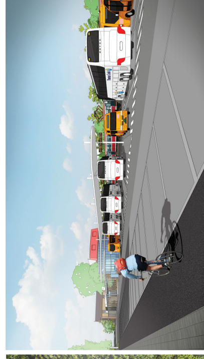
WIZUALIZACJA | WIDOK WĘZŁA PRZESIADKOWEGO OD STRONY PÓŁLUDNIOWO-WSCHODNIEJ