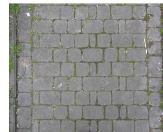
SPOSÓB UŁOŻENIA KOSTKI CHODNIK SZER. 121-122 - KONTYNUOWAĆ ISTNIEJĄCY WZÓR