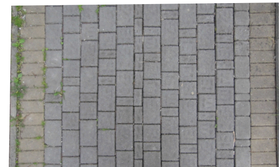
SPOSÓB UŁOŻENIA KOSTKI CHODNIK SZER. 200-202 - KONTYNUOWAĆ ISTNIEJĄCY WZÓR