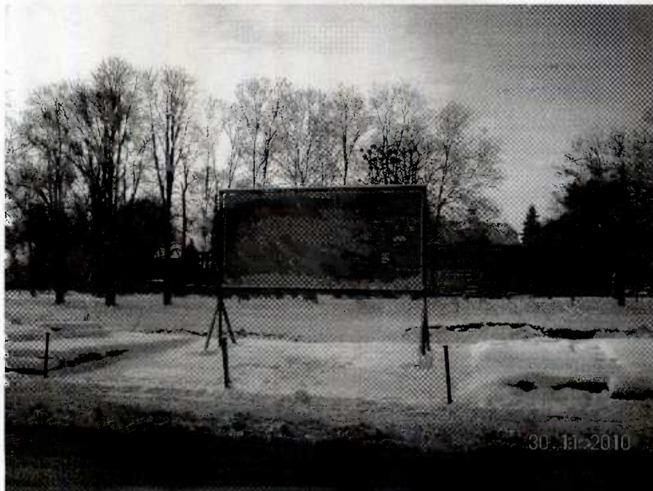
Baner przedstawiający założenia projektu – Koncepcja zagospodarowania terenu po polskiej i czeskiej stronie granicy.