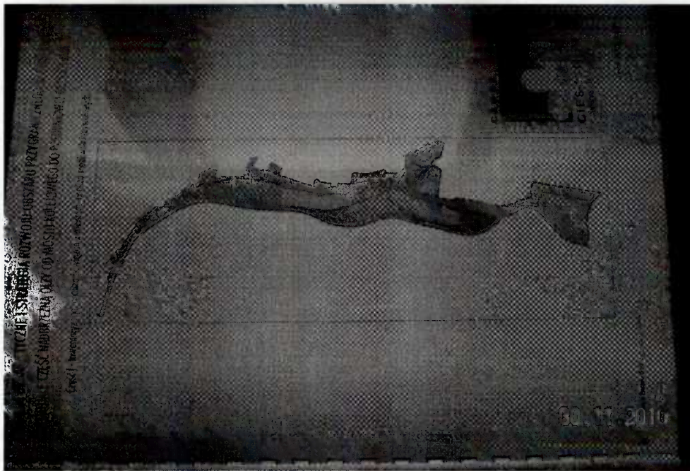
Produkt projektu – Studium urbanistyczne i strategia rozwoju obszaru przygranicznego (cz.I)