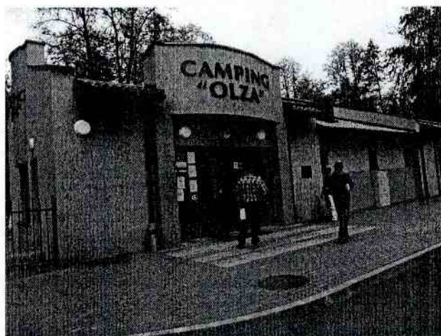
2. Kemping „Olza”