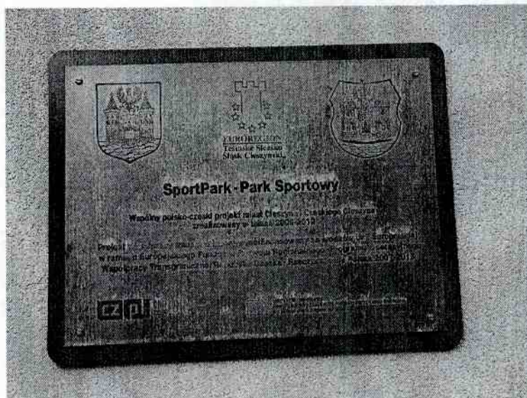
3) Tablica pamiątkowa