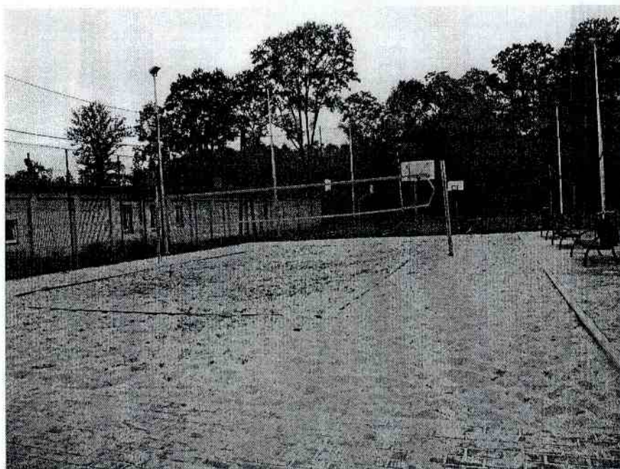
4) Zespół boisk i zaplecze socjalne