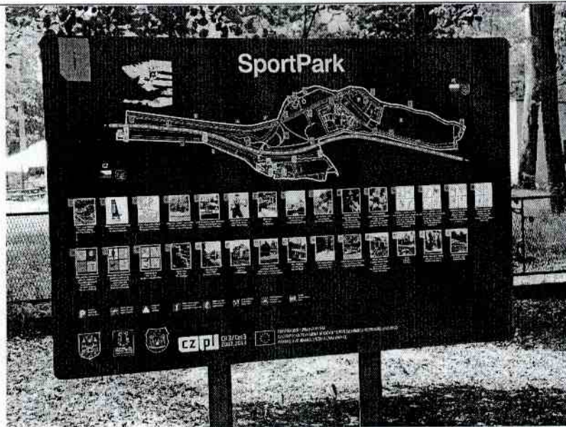
5) System identyfikacji wizualnej